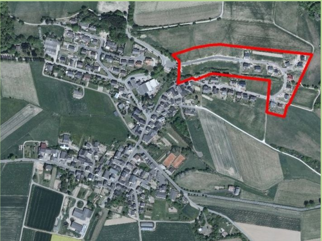
Geisig aus der Vogelperspektive mit dem Umriss des Neubaugebietes

Bei uns können Sie sich den Traum vom eigenen Heim verwirklichen!